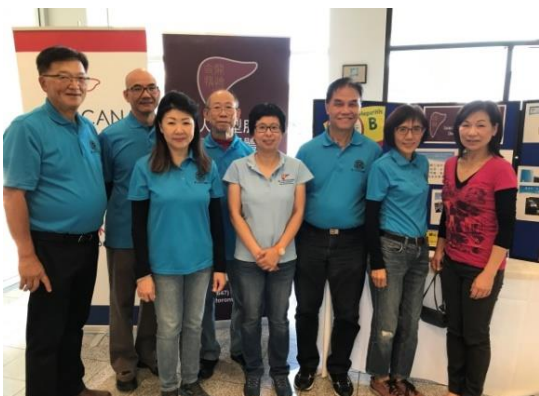
攝於今年華人健康關注日活動

值著今年本團體活動接近尾聲，本人想借次機會、再次感謝各位長期支持本團體活動的朋友、義務擔任講座主講嘉賓的專業醫護人士和義工們。多謝各捐款的商業機構、社區團體和出席講座活動並捐款支持本團體的朋友。期望你們的支持會繼續延續下去。祝各位身體健康！生活愉快！