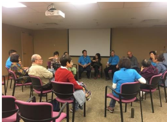
會員參加健康講座後的交流小組